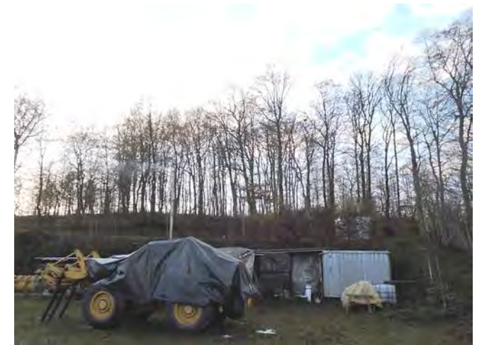
Blick aus östlicher Richtung auf Parz. 10/2