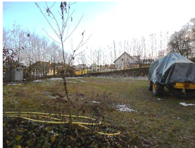
Blick aus nördlicher Richtung auf das/die Grundstück/e Parz.10/2+9