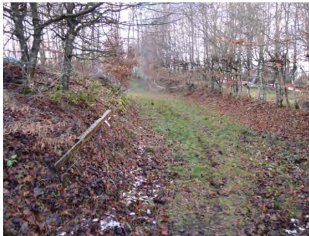
der nördlich gelegene Weg auf das Grundstück