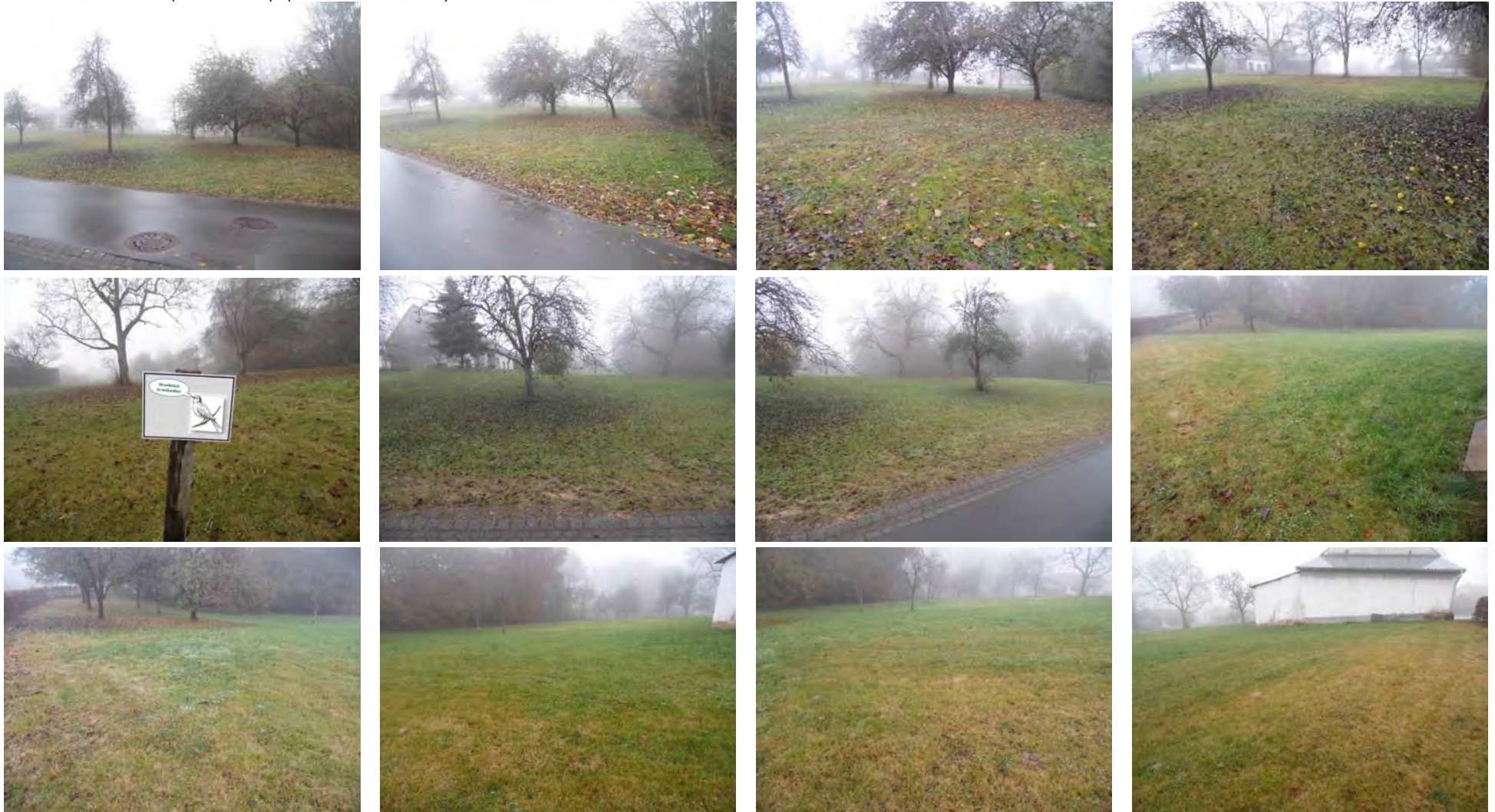
Fotos der Parzellen (rot markiert) (Stand: 2016-11-14)

Zaums Immobilien Prüm — Anfragen unter Tel. 0 65 51 / 96 55 80 oder per E-Mail info@zaums-immobilien.de