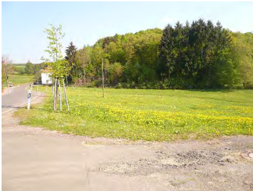
(Sicht in Richtung Norden)