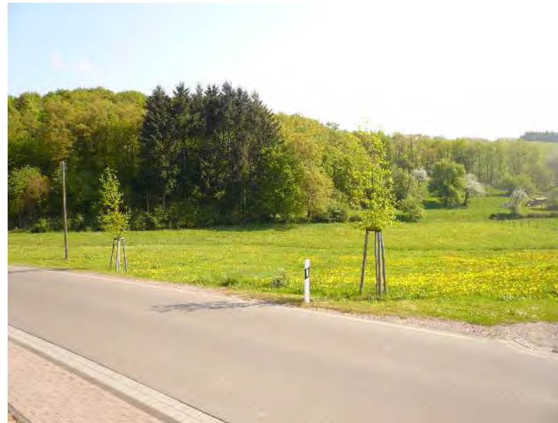
(Sicht in Richtung Osten)